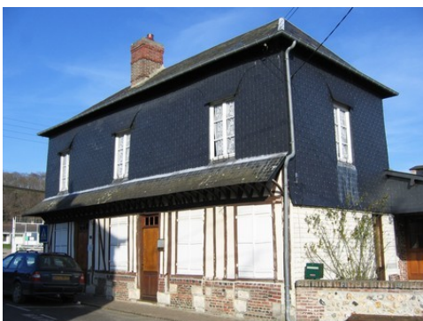
L'essentage en ardoises