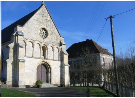
L'église et les bâtiments monastiques