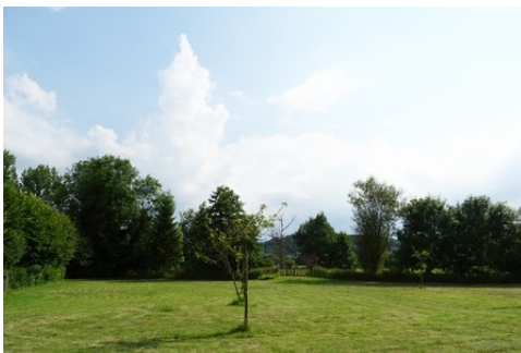
La vue vers la Risle, au Sud

Les avis seront cohérents avec ceux émis ces derniers années, à savoir : pas de maisons à volume compliqué (type V, W, Y, ou Z), pentes à 45° pour les volumes principaux, ardoise ou tuile plate de teinte brun vieilli, à 20u/m², avec un débord de toiture de 20cm, enduit de teinte beige clair avec modénatures (au choix : chaînages, encadrement de fenêtres, soubassement, colombage...). *Voir les autres fiches.