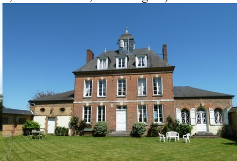
Une belle architecture de briques