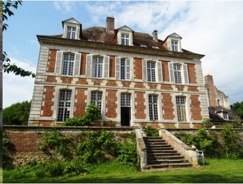
L'aile sud en brique et pierre de taille