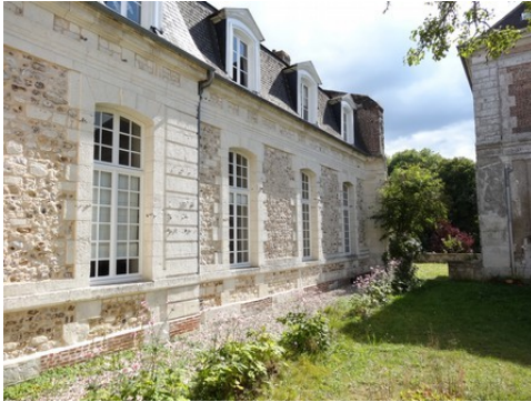
L'aile est autour bordant le cloître