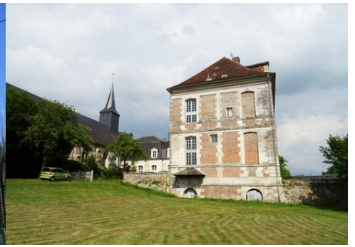
L'aile sud du cloître et l'église