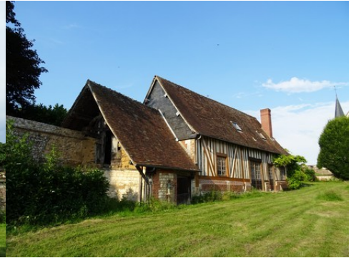
Une dépendance intégrée à la clôture

Pour la zone en rose foncé dans le périmètre de 500m