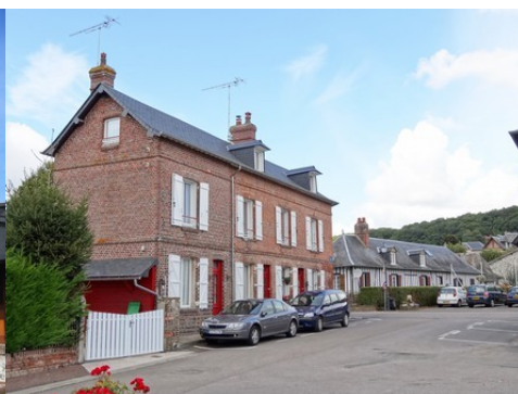
Une maison en briques