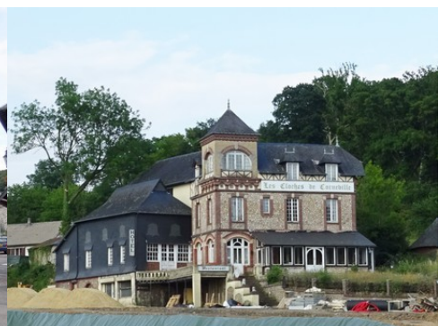
L'auberge de Cloches de Corneville