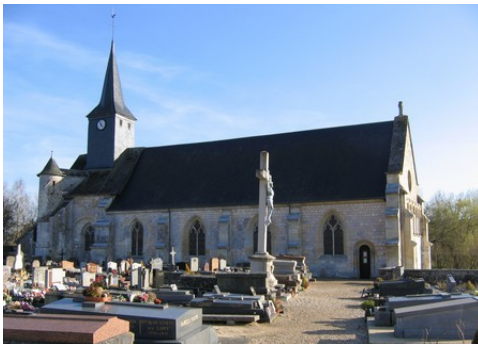
L'église paroissiale depuis le cimetière