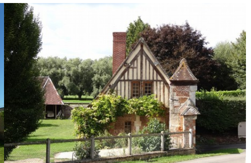
Une maison à pans de bois